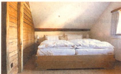
Auch die Schlafzimmer sind frei von jeglichem Schnickschnack.

jetzt 50 Zimmer zur Verfügung. Und die haben es in sich: Fernab von jeglichem Kitsch zauberten die Zürcher Architektinnen Jasmin Grego und Stephanie Kühnle einen grandiosen Mix aus modernem Lifestyle, Maiensässfeeling und Alpenromantik in die elf bis zu 300 Jahre alten Ställe, Hütten und Speicher. Ebenfalls neu sind ein Wellnessbereich im Stall, eine Tiefgarage und gediegene Seminarräume. Geblieben sind das mit einem «Michelin»-Stern ausgezeichnete Gourmetrestaurant und das auf einheimische Spezialitäten ausgerichtete Restaurant Crap Naros.